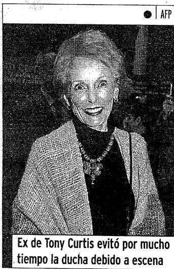
Ex de Tony Curtis evitó por mucho tiempo la ducha debido a escena