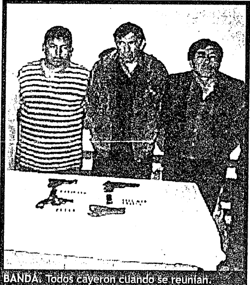
BANDA. Todos cayeron cuando se reunían.

con droga, pero al revisar el auto se encontraron debajo del asiento del chofer tres pistolas, incluida la del policía, de las cuales dos de ellas estaban con la serie limada.