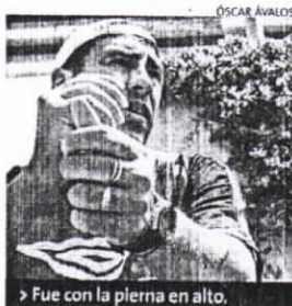
> Fue con la pierna en alto.