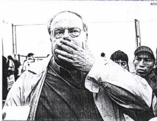
Burga envió carta al club, que la consideran amedrentadora.