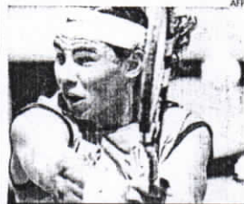
> El español aplastó a Gasquet.

El suizo Roger Federer, número uno del mundo, batió al chileno Fernando González por 7-6 (9), 7-5 y 6-2 para avanzar a octavos de final de Roland Garros, al igual que el español Rafael Nadal, cuarto favorito, que arrasó al francés Richard Gasquet por 6-4, 6-3 y 6-2. También avanzaron el español Carlos Moyá, la belga Kim Clijsters y la estadounidense Lindsay Davenport. Venus Williams (EE.UU.) cayó ante la búlgara Sesil Karatantcheva por 6-3, 1-6 y 6-1.