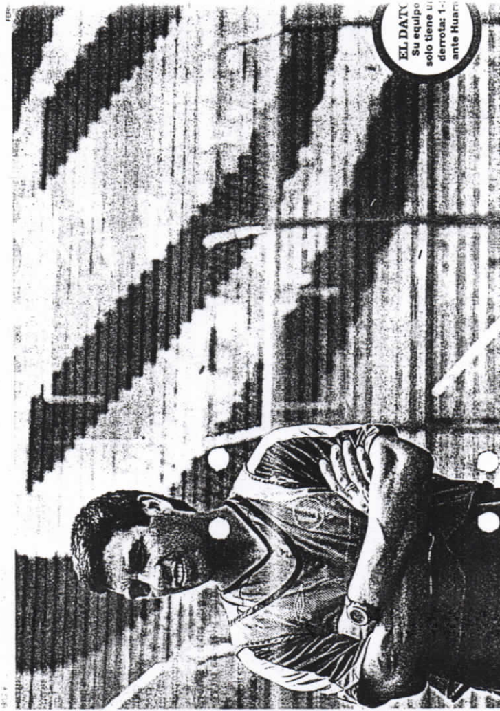
EL DATO Su equipo solo tiene un derrotar: 1: ante Huari

CON EL NO HAY TÉRMINO MEDIO. CUANDO HABLA, QUE POR QUÉ HABLA, Y CUANDO OPTA POR EL SILENCIO EN TODO CASO, CUANDO SIENTE QUE DEBE HACERLO, ARROJA SUS OPINIONES. ESO SÍ, ALGUNAS DE ELLA