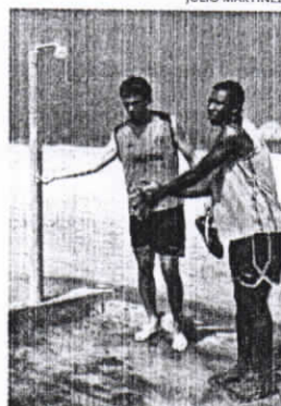
No juega por cupo de extranjeros.

¿Te estás guardando para la Sudamericana? "No, no, nada que