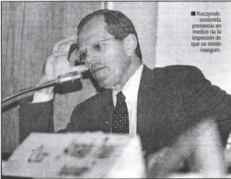
■ Kuczynski: sostenida presencia en medios da la impresión de que se siente inseguro.

anuncio de revisión de las exoneraciones otorgadas a determinadas economías regionales, de las zonas más deprimidas del país.