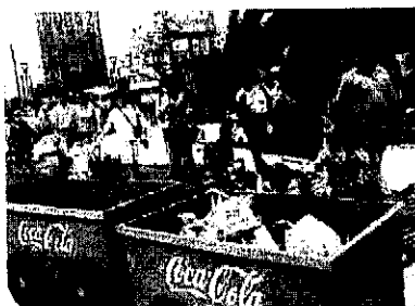
La Navidad se vive en el Parque de la Cultura con alegría y solidaridad.

Los lectores pueden enviar fotografías a la siguiente dirección electrónica: opinion@larepublica.com.pe (en extensión JPG o GIF)