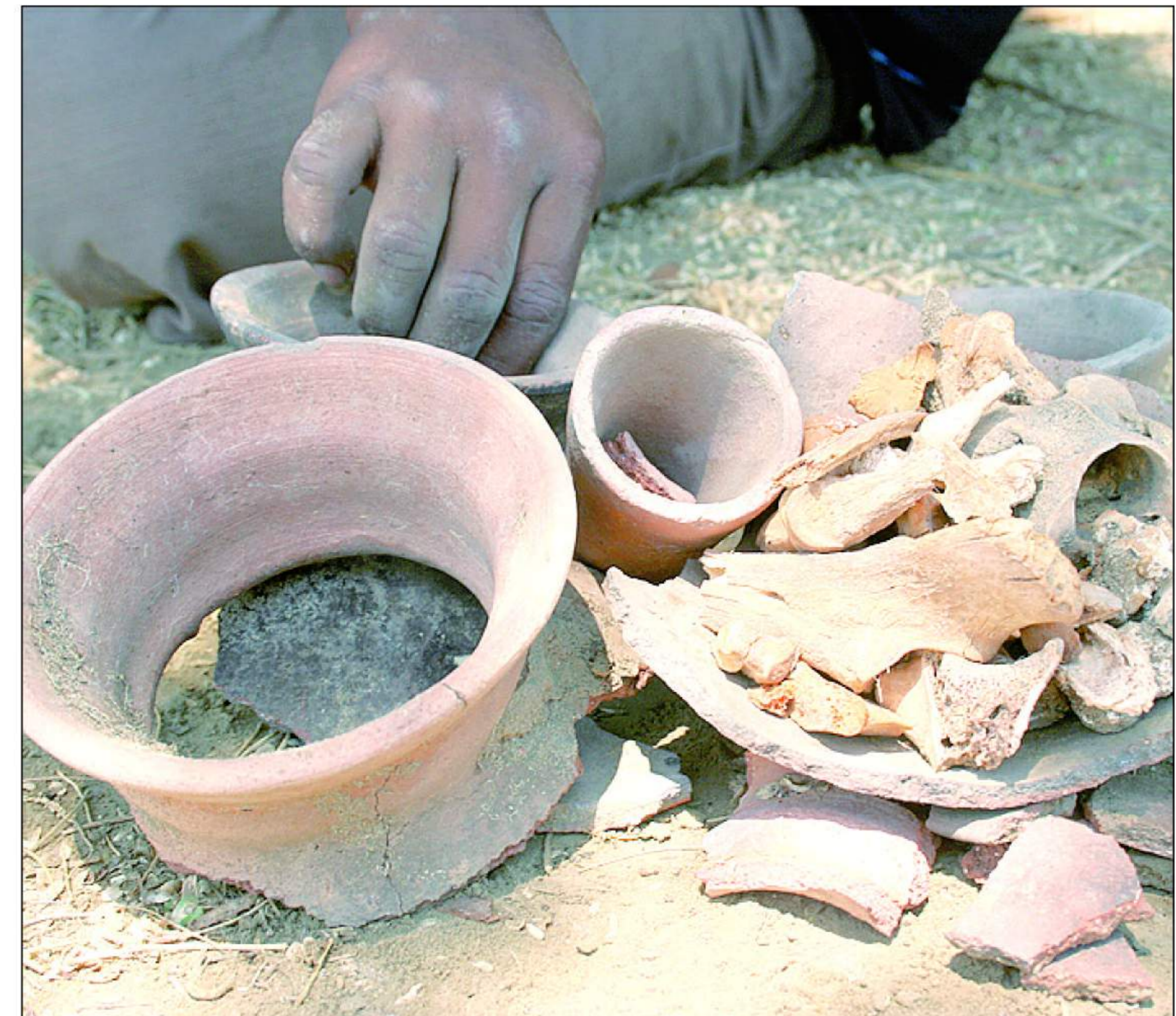
Huesos y restos de cántaros, lo que han dejado los huaqueros