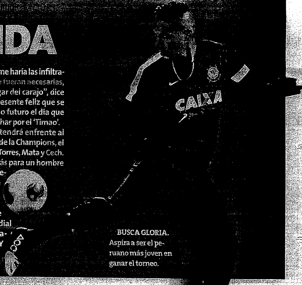
BUSCA GLORIA. Aspira a ser el peruano más joven en ganar el torneo.

Mundial, me haría las infiltraciones que fueran necesarias, quiero jugar del caja", dice en este presente feliz que se trazó como futuro el día que decidió fichar por el 'Timao'. Guerrero tendrá enfrente al campeón de la Champions, el del 'Niño' Torres, Mata y Cech. Un reto más para un hombre que supo renacer. Que sabe lo "importante" que es el Mundial para su carrera. Y para el Perú.