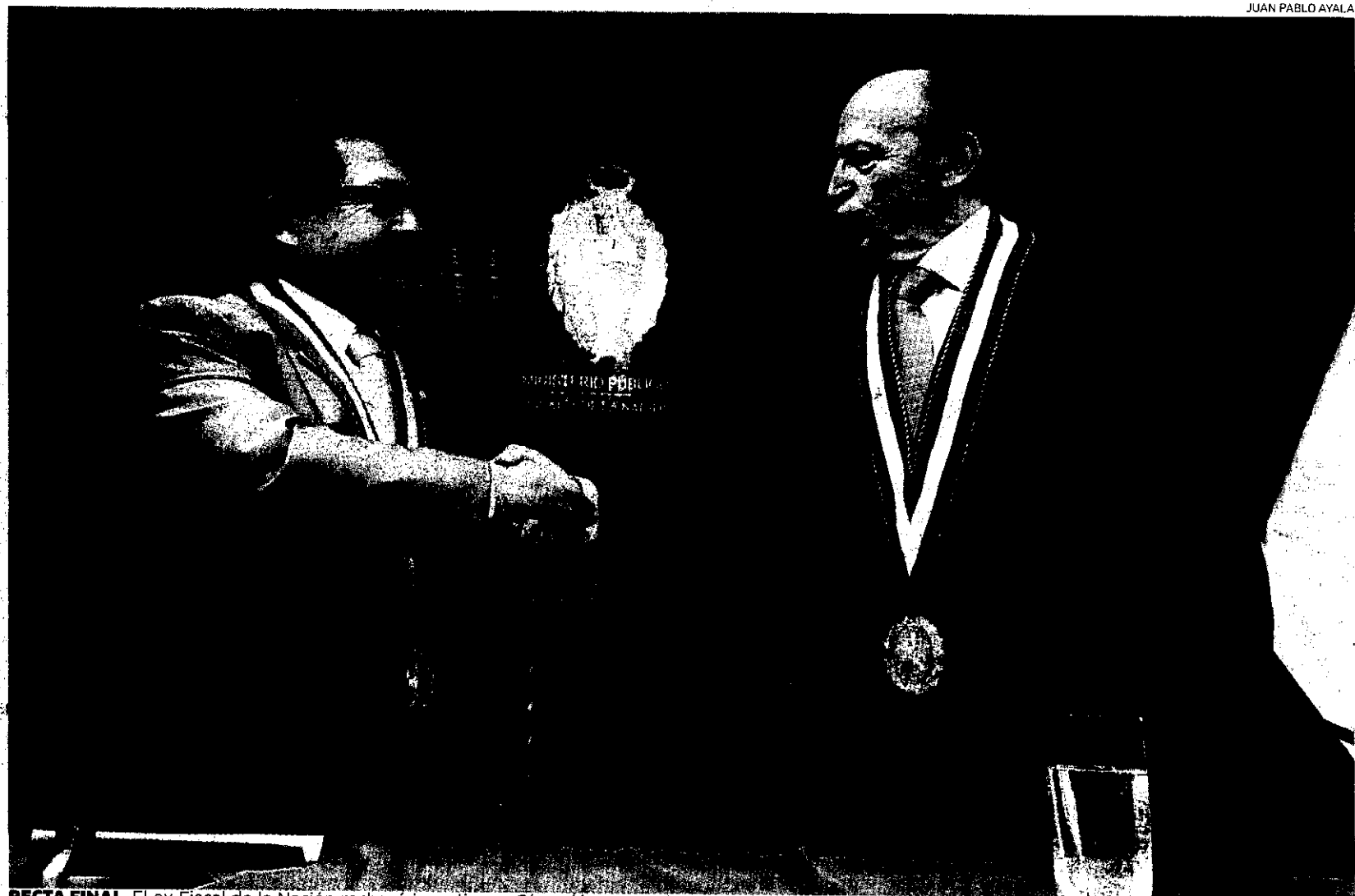
RECTA FINAL. El ex Fiscal de la Nación rechazó investigar a César Álvarez en 2011 y 2013. En el tema de Áncash aparece más expuesto que Carlos Ramos.

Por lo menos dieciséis personas habían ingresado dinero a favor del chofer, por más de cincuenta mil soles. Ramírez, con un sueldo mensual de mil quinientos, no podía justificar su riqueza. La fiscalía unificó tres expedientes de la investigación al chofer con la original denuncia contra Álvarez,