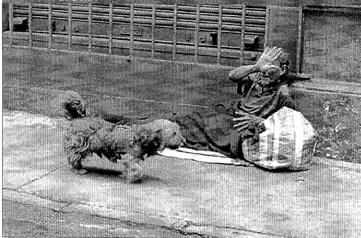
IMAGEN A LA CARTA