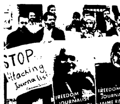
LIBERENLO YA. Periodistas palestinos se mostraron indignados por el secuestro del fotógrafo peruano