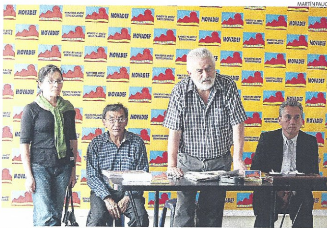
■ SIN PISO. La instancia electoral advierte que el Movadef puede socavar la democracia.

La resolución—de 21 páginas—analiza no solo aspectos de carácter jurídico sino también ideológico y doctrinario, pero resalta en forma especial el “carácter violento” de la estrategia aplicada por el Movadef que, recuerda, fue la que siguió Sendero Luminoso décadas atrás. “Ante la posibilidad latente de que el Movadef lleve a la práctica el ‘pensamiento Gonzalo’ y socave el sistema democrático, valiéndose de actos violentos que ya en el pasado derivaron en