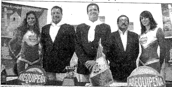
PRESENTARON el II Concurso Provincial del Caballo Peruano de Paso.

En Cerro Juli, estarán presentes criadores de Tacna, Puno y Arequipa.