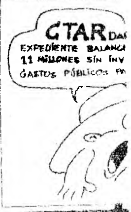
LA FRASE DEL «El poder humano no tien

Señor Director Su presencia se siente, se percibe, sabemos que está allí, escondida y al bombardea incesantemente los cerebros dándolos. Es un acto que se impone y norándolo inconscientemente para evit : sa. Se prefiere la costumbre y la inútil : las decisiones, el dominio, y el man : cama es débil y el espíritu naquea. E : efecto narcotizante de la fe, pero sig