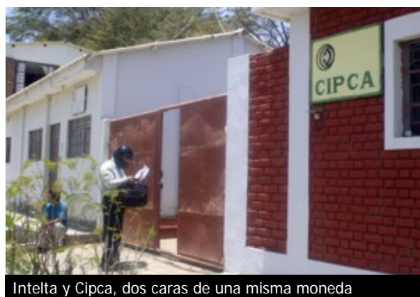
Intelta y Cipca, dos caras de una misma moneda