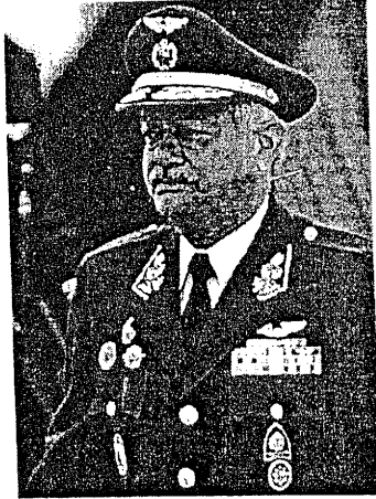
Dedocracia en el Ministerio de Defensa.